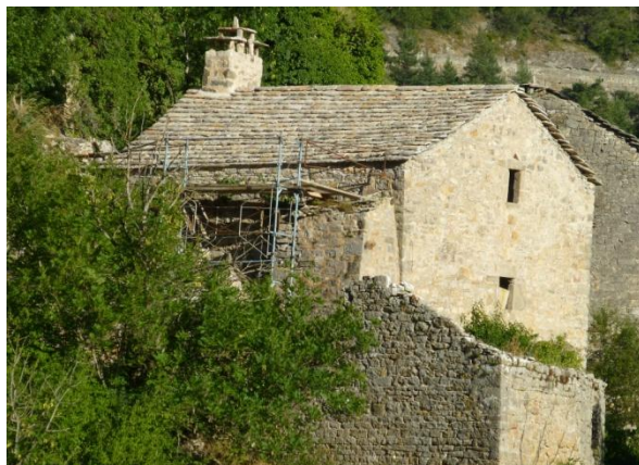
automne 2016 : la toiture est terminée