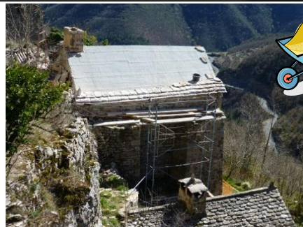
mars 2016 : début de la pose des lauzes