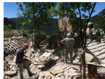
Fin mai : la moitié de la couverture est réalisée